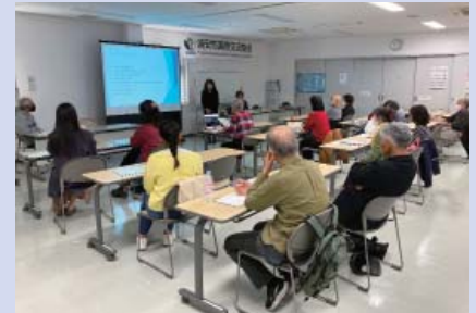
姉妹都市交流部会

来年2月に浦安市の姉妹都市オーランド市(米国フロリダ州)を市民親善の旅「友好の翼」で訪問する予定です。その計画の実現に向けて、事前にオーランド市の紹介、姉妹都市提携の経緯、2020年の友好の翼のビデオ上映等の説明会を実施しました。また、オーランド市名物の「ワニのから揚げ」も試食しました。鶏肉のような味でした。26名の方々が参加され、楽しい雰囲気の中で盛会でした。中には前回の友好の翼に参加された方々が当時の思い出話に花を咲かせていました。